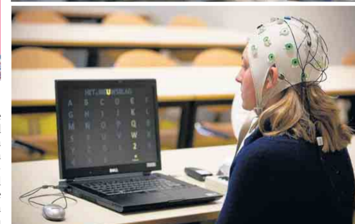
De computer weet via de 'muts' aan welke letter onze reporter denkt.

lang genoeg geconcentreerd naar jouw letter kijkt, begrijpt de computer dat. Op die manier kan je woorden vormen zonder een spier te verroeren, en dat werkt nog ook. Dankzij de gel, de muts en de kabels lijkt die computer te weten dat we aan een 'e' denken. Sciencefiction? Niet meer, zo blijkt.